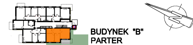
BUDYNEK "B" PARTER

POWIERZCHNIA MIESZKANIA 54.44 m 2 POWIERZCHNIA DZIAŁKI 138.00 m 2