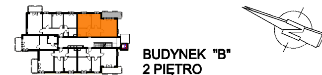
BUDYNEK "B" 2 PIĘTRO