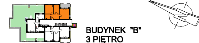
BUDYNEK "B" 3 PIĘTRO