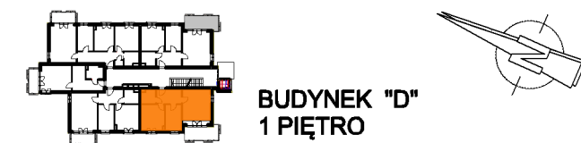
BUDYNEK "D" 1 PIĘTRO

POWIERZCHNIA MIESZKANIA 56.67 m 2 POWIERZCHNIA BALKONU 10.22 m 2