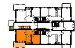
BUDYNEK "E" 1 PIĘTRO