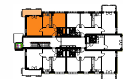
BUDYNEK "E" 2 PIĘTRO