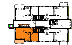
BUDYNEK "E" 3 PIĘTRO