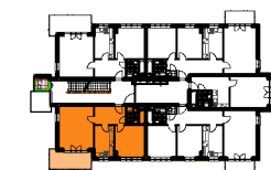
BUDYNEK "F" 1 PIĘTRO