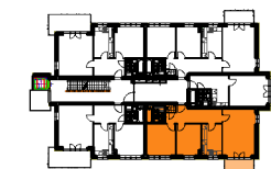
BUDYNEK "F" 1 PIĘTRO