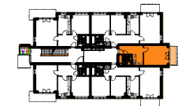
BUDYNEK "F" 2 PIĘTRO