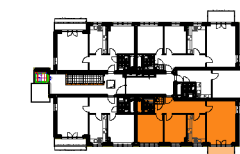
BUDYNEK "F" 3 PIĘTRO

POWIERZCHNIA MIESZKANIA 73.44 m 2 POWIERZCHNIA BALKONU 5.25 m 2