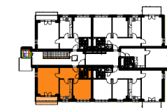
BUDYNEK "F" 3 PIĘTRO

POWIERZCHNIA MIESZKANIA 56.68 m 2 POWIERZCHNIA BALKONU 6.06 m 2