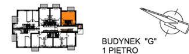
BUDYNEK "G" 1 PIĘTRO