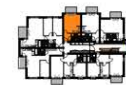
BUDYNEK "G" 3 PIĘTRO