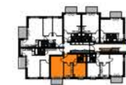
BUDYNEK "G" 4 PIĘTRO